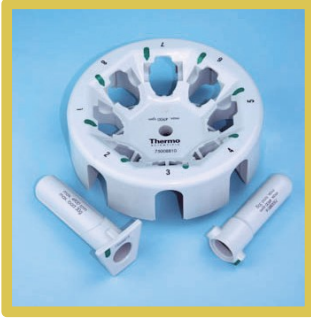
Benzersiz hibrit tasarımı DualSpin rotor