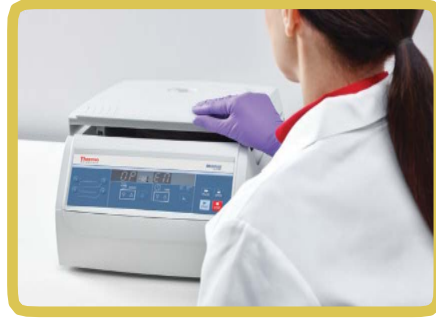
Tek tıkla açılan kapak