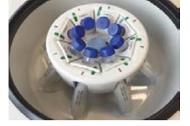
DualSpin rotor, sabit açılı kovacaklarla