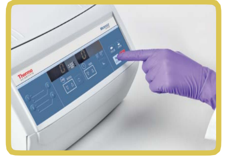
Geniş, parlak gösterge ve sezgisel kontroller