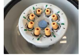
DualSpin rotor, açılır kovacaklarla